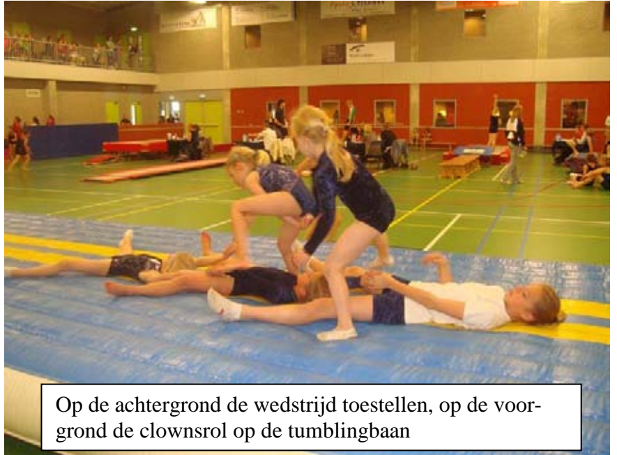
Op de achtergrond de wedstrijd toestellen, op de voorgrond de clownsrol op de tumblingbaan