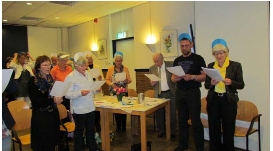
Het feestlied werd uit volle borst door iedereen meegezongen