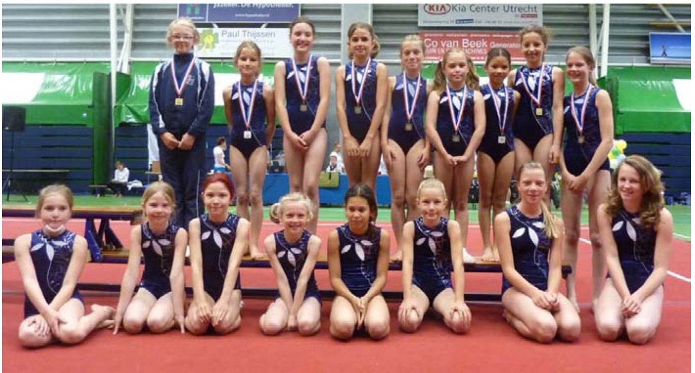
Deelnemers ronde 1

Ook dit turnseizoen werd weer afgesloten met een toestelfinale.