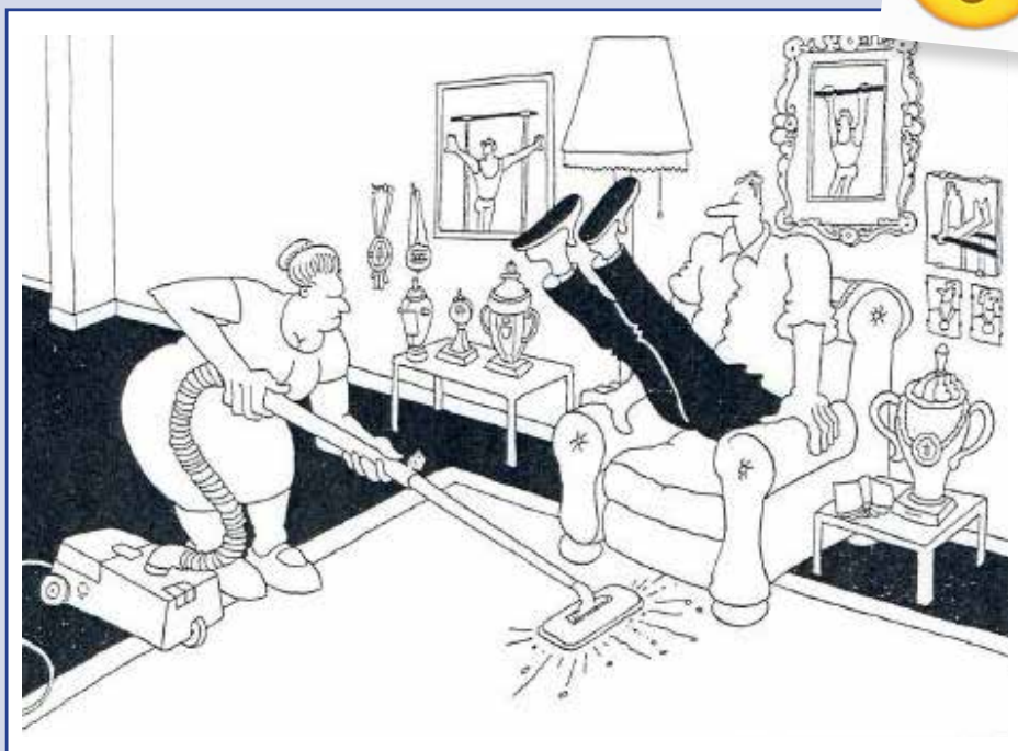
Turnen in het corona tijdperk