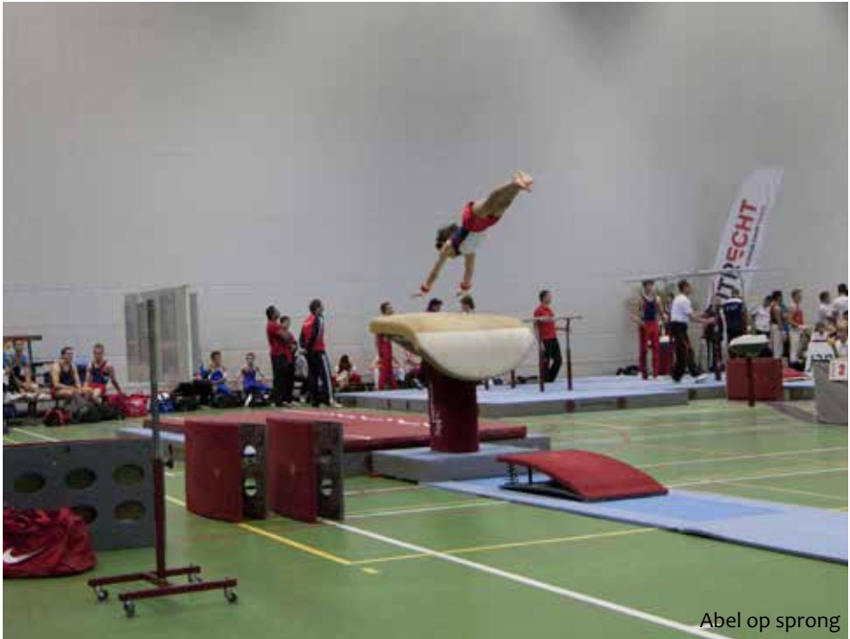
Abel op sprong