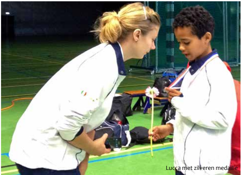
Lucca met zilveren medaille