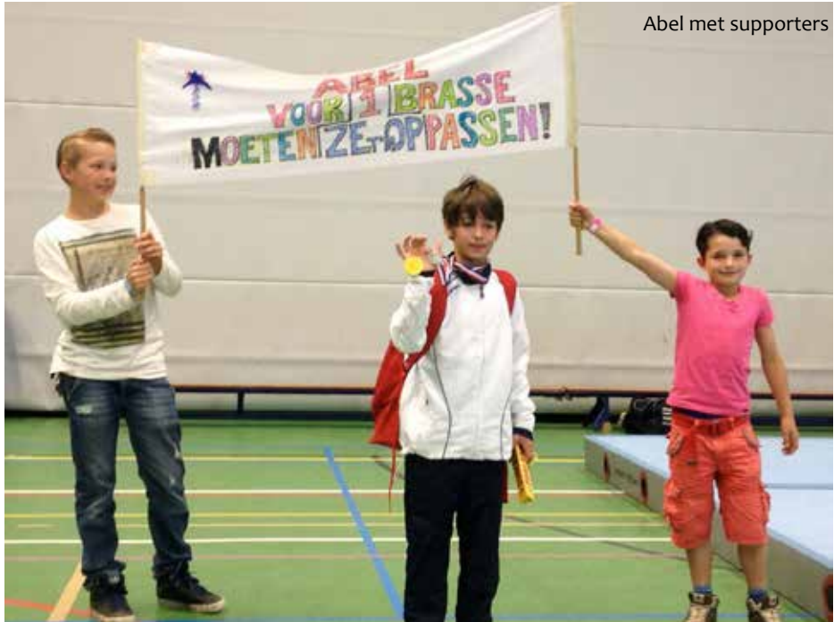
Abel met supporters