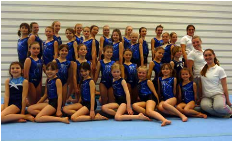
nieuwe pakjes C-selectie