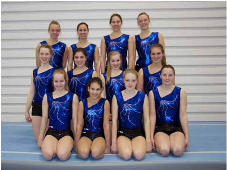
nieuwe pakjes A-selectie