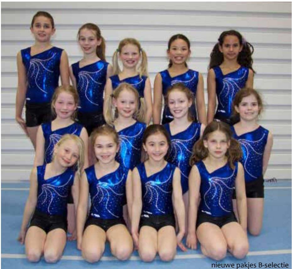
nieuwe pakjes B-selectie

Utrechtse Christelijke Vereniging voor Lichamelijke oefening opgericht 6 mei 1893