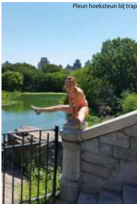
Pleun hoeksteun bij trap