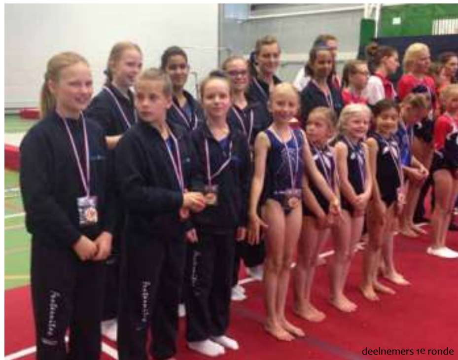
deelnemers 1e ronde

Zo gingen alle deelnemers met een 'medaille' de deur uit. Mooi gebaar!!