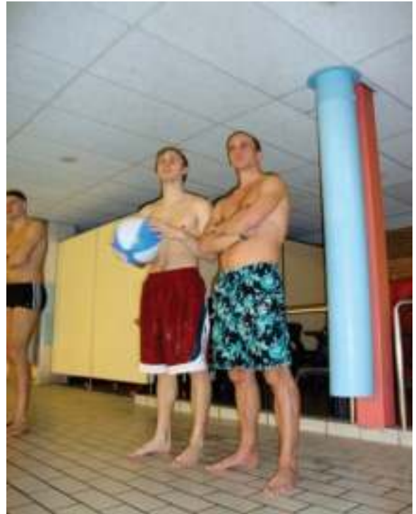
..... de beste stuurlui staan aan wal!!!