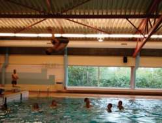
Kosse doet hard z'n best... maar....

Iedereen ging mee en het zwembad was op-eens wel erg vol. Met z'n allen in de rij voor