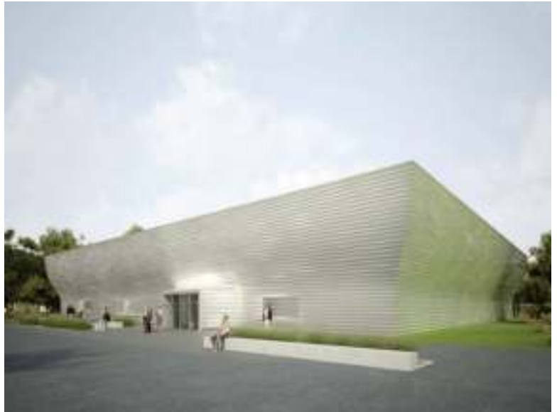
Ontwerp van de turnhal die in Utrecht komt.

Als je goed kijkt kun je zien dat het gebouw aan de bovenkant breder uitloopt. Dit zorgt ervoor dat er echt daglicht naar binnen schijnt zonder dat er ruiten zijn.