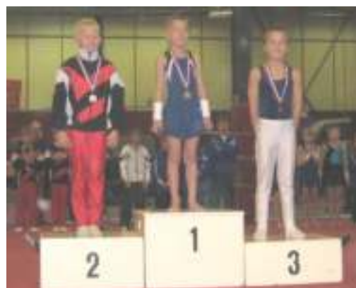
Bas, 3e bij Instap 1e divisie

Helaas zal het Steven niet lukken zich te plaatsen. Hij heeft een aanrijding gehad en is met een gebroken sleutelbeen tijdelijk uitgeschakeld. Steven; beterschap!!!!