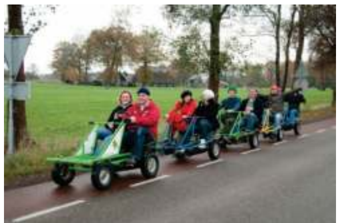
Treintje rijden op de fiets...

fiets. Een mooie tocht door een stukje Drenthe, met hier en daar een opstopping of een verkeerde afslag. Er werden ook nog een paar Gotsha opdrachten gedaan en na een tocht van ruim een uur was iedereen moe van het harde trappen (Nou niet iedereen hoor, je kon goed smokkelen).