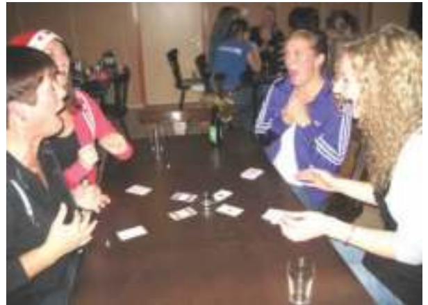
Veel vermaak tijdens halligalli

Gelukkig mochten we uitslapen op zaterdag, maar om 10.15 moesten we weer klaar staan om naar een Koeien Hotel te gaan.