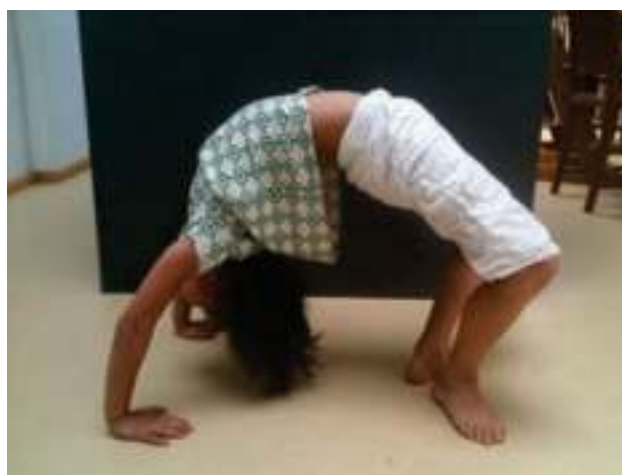
Kamili → boogje thuis, want zij zijn deze zomer verhuisd