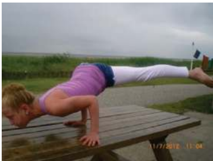
Puck ↑ krokodil bij het wad op Terschelling