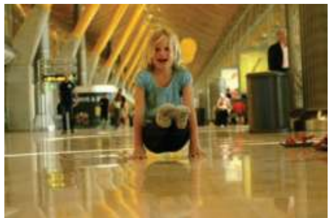
Gabi ↑ hoeksteun op het vliegveld van Madrid