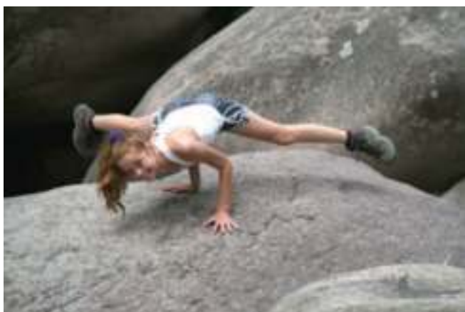
Julé ← krokodil op de rotsen tijdens het wandelen